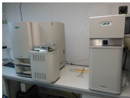
Rys. 7: Zestaw TruSpec CHNS do analiz pierwiastkowych paliw stałych

W badaniach nad zawartością chloru posłużono się znormalizowaną metodą Mohra.