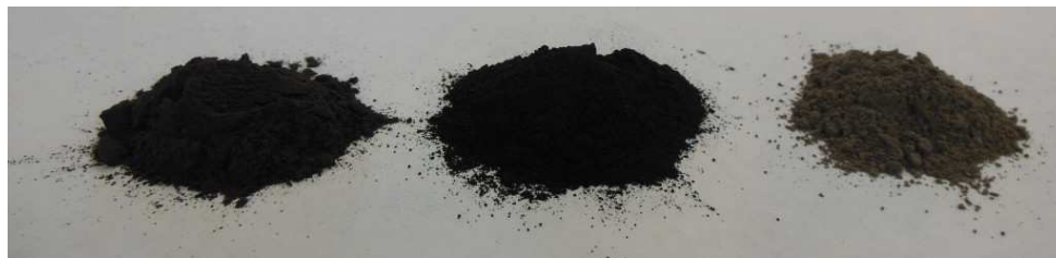
Rys. 3: Przygotowane do badań próbki paliwowe, od lewej: węgiel brunatny, węgiel kamienny oraz osad ściekowy

Analizom podlegały reprezentatywne próbki paliw, uprzednio wysuszone oraz rozdrobnione do wielkości ziarna poniżej 200 \mu\text{m} (rys. 3.). Wszystkie analizowane próby znajdowały się w stanie analitycznym (powietrzno-suchym).