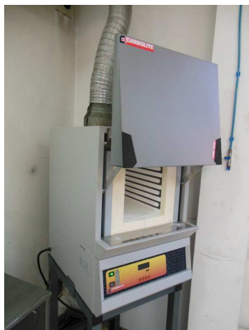
Rys. 4: Programowalny piec mufłowy CARBOLITE CWF1200