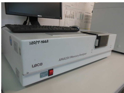
Rys. 6: Analizator AMA 254 do oznaczania rtęci całkowitej w paliwach stałych

W przypadku analizatora rtęci AMA254, producent wskazuje ponadto na zgodność pracy urządzenia ze standardami ASTM D6722 oraz EPA Method 7473.