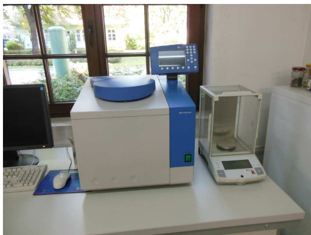
Rys. 5: Kalorymetr automatyczny IKA C2000 basic

W badaniach wykorzystano programowalny piec mufłowy CARBOLITE CWF 1200 (rys. 4.). Czas trwania procesu termicznej obróbki, szybkość nagrzewania oraz temperatury robocze dobierano zgodnie z normami podanymi powyżej.